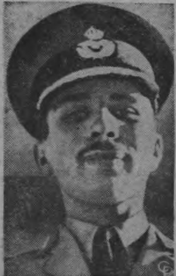
Rey HUSSEIN DE JORDANIA convocó a los Estados árabes...

AYER SALIERON LOS PRESOS POLITICOS DE LAS CARCELES HONDURENAS