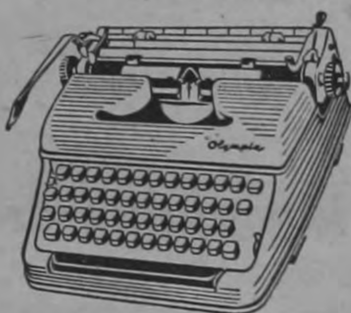
UNA MAQUINA PORTATIL DE ESCRIBIR "OLIMPIA".