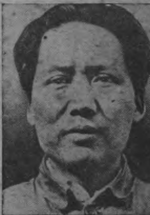
MAO TSE TUNG