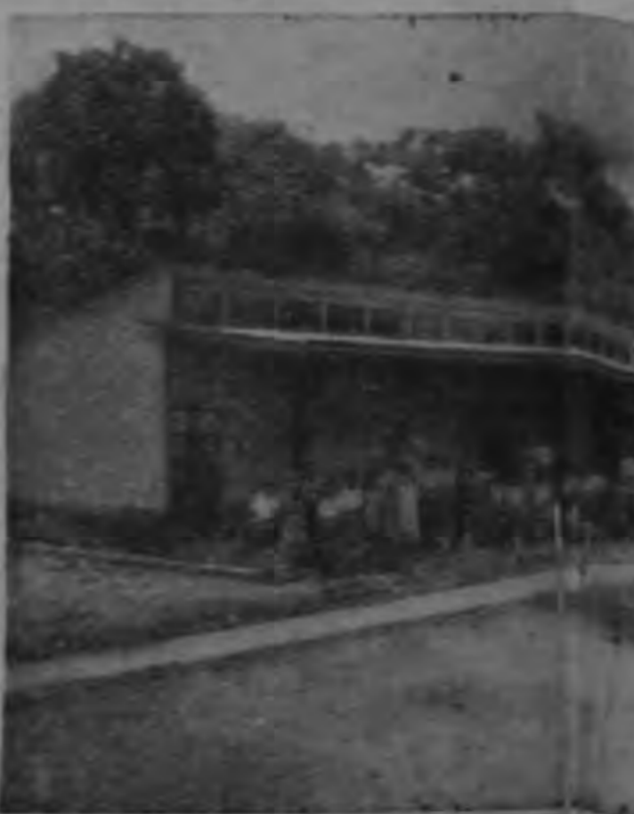
ESCUELA SAN JOSECITO DE ALA Actual Administración por medio de Man... con una erogación de más de $100 mil... escolar amplias aulas donde con... escuelas sus lecciones. Está dotad... servicios sanitarios. La magnífica... tación se ve facilitada por estos locales... territorio nacional.