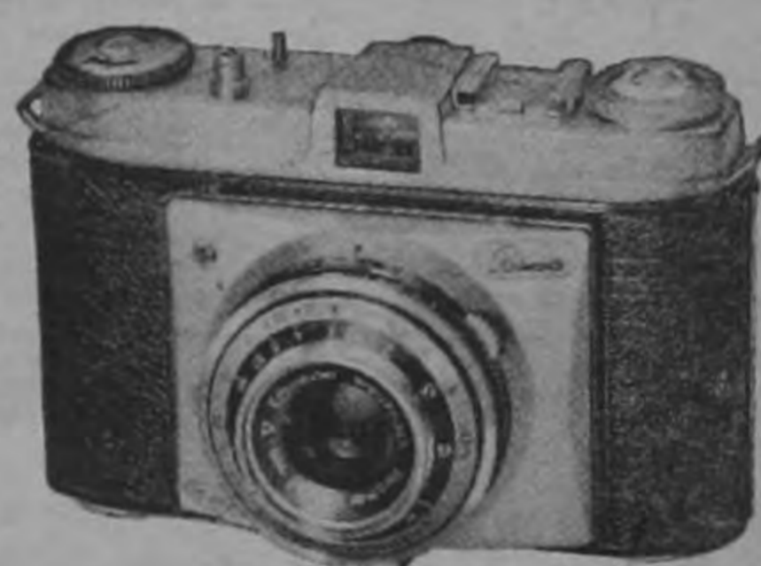
UNA MAGNIFICA CAMARA KODAK TIPO "RETINETTE".